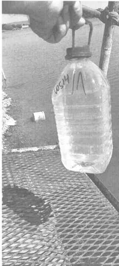
V0514/1 Površinska voda – jezero Borkovac