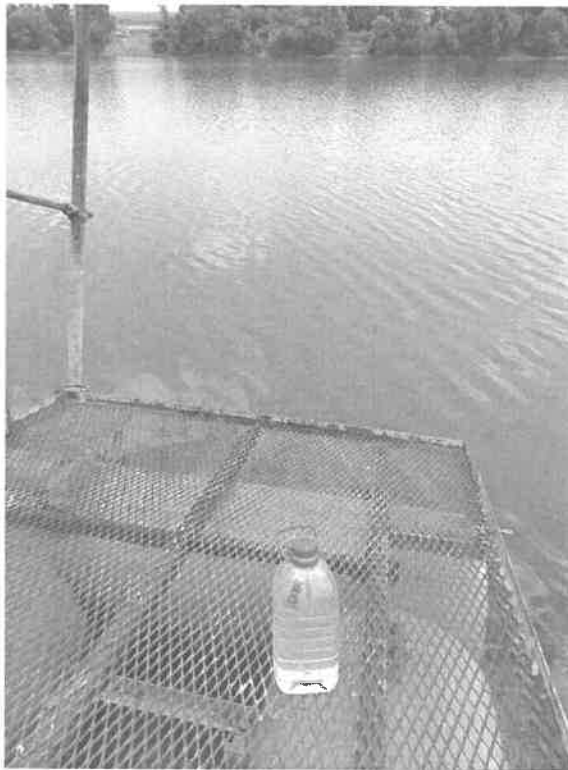
V0496/1 Površinska voda – jezero Borkovac